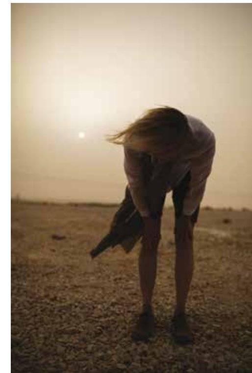
מצפה רמון בשיא סופת האבק. השמש נראית נקודה קטנה בשמים העכורים

כמעט שאיננו מספיקים לעשות היכרות וכבר אנו בדרכנו למושב צפרירים. שם אני