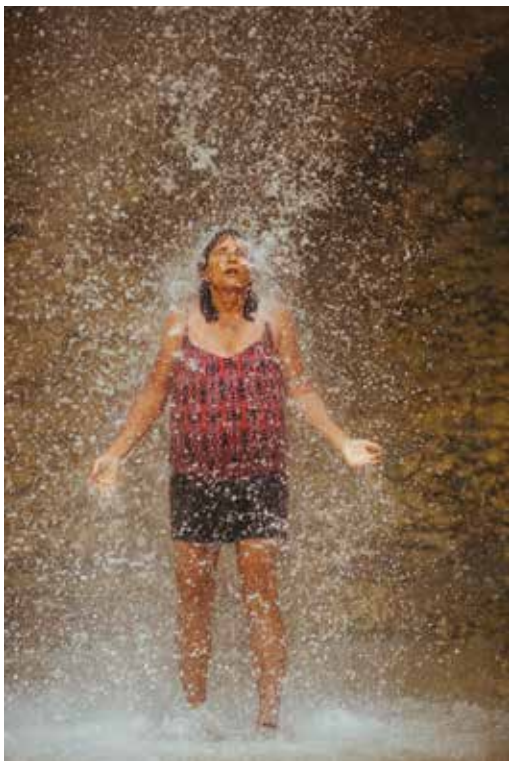
היום האחרון: טבילה מרעננת במפל עם סיום הטיפוס בוואדי מוחיירים

לבסוף החילוץ מגיע ואנחנו דוהרים לתחנת הגבול. שם מתברר לנו כי מדובר ברכב המוביל את הנוסעים בין שני עברי הגבול וכי כל מי שהיה במקום התעכב. וגם כי החזיקו את המעבר פתוח במיוחד בשבילנו. נראה שגבולות אפשר לחצות וגם לכופף אם כולם משתפים פעולה. ●